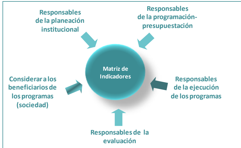
Figura 6. Principales involucrados en la aplicación de la MML

Cuando se trata de programas, es importante considerar entre los involucrados que deben participar en las distintas etapas de la MML y sobre todo, en la elaboración de la MIR , además de la Unidad o Unidades Responsables de la ejecución del programa, a personal de las áreas de planeación, evaluación, programación y presupuestación, cuando menos.